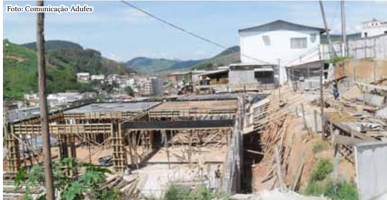
Obra em andamento do prédio de laboratórios dos cursos do Reuni no CCA.