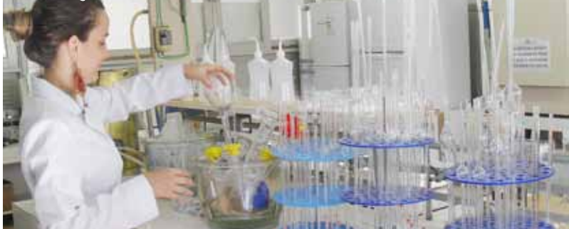
Estudantes enfrentam dificuldades com estrutura e falta de materiais em disciplinas práticas.

de estudantes porque não tem espaço”, explicou Colistete. Ele afirmou que, caso a obra do novo prédio atrase por mais tempo, as disciplinas práticas poderão ser prejudicadas. A previsão é de que essa obra seja concluída até o fim deste ano.