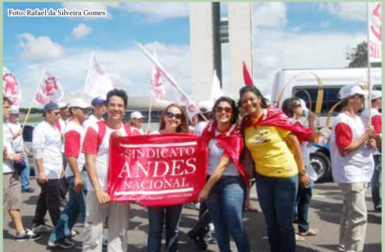
Professores da Adufes participam do ato em Brasília.