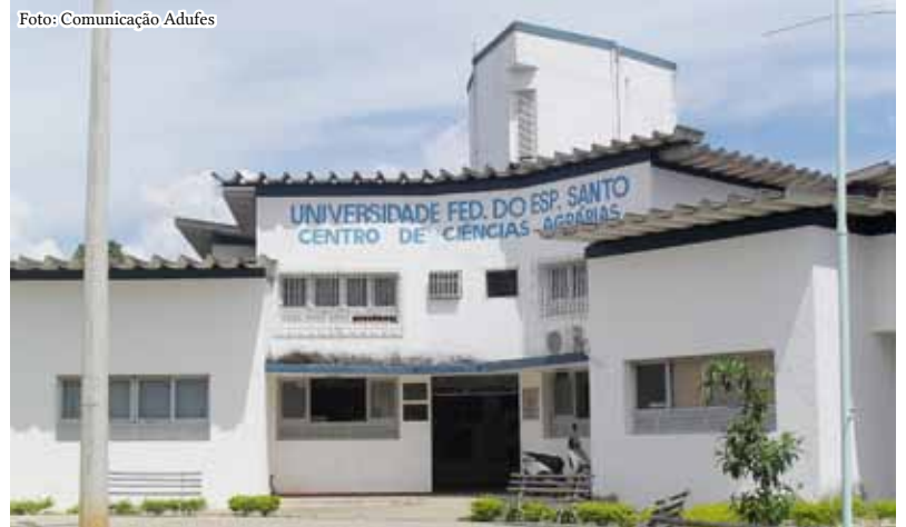
Em cerca de 6 anos, o CCA passou de 4 para 17 cursos.