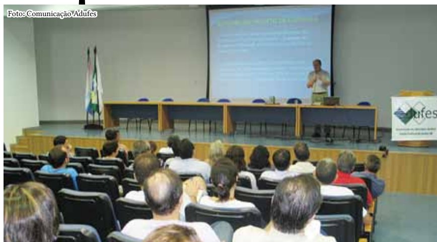
Projeto de Carreira defendido pelo Andes-SN é apresentado em debate no campus de Goiabeiras.

No entanto, para que a proposta do Andes-SN sobre a Carreira do Professor Federal seja aprovada pelo Governo, é